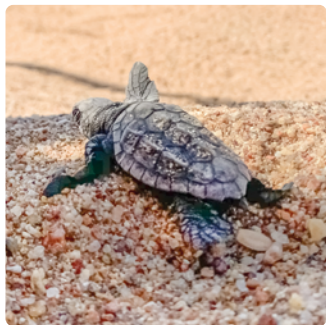
Tortue Caouanne juvénile

cultures maraîchères, arboriculture, viticulture, ainsi que du pâturage et des activités d'horticultures et de pépinières. Cette diversité met en valeur le rôle primordial de l'agriculture locale dans la plaine alluviale de l'Argens.