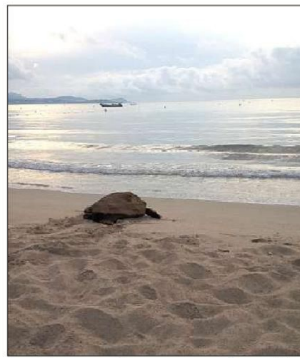
Sa mission accomplie, maman tortue s'en est allée...