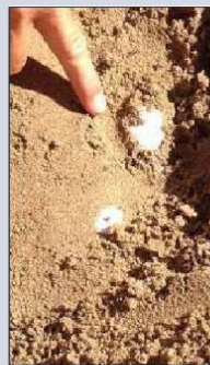
Dès les tout premiers œufs découverts par l'experte, toute la zone a été quadrillée.