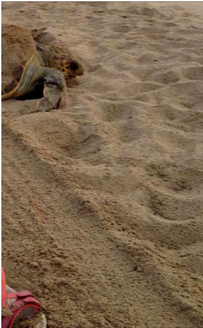
en ce matin-là, il y a quelques jours...