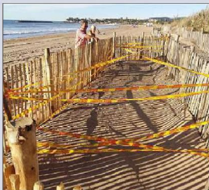
Le lieu de ponte est aujourd'hui clôturé par des ganivelles pour empêcher toute intrusion.

place des ganivelles pour sécuriser le nid. Des panneaux d'explications pour le public vont être installés ensuite. Il y a une volonté commune de chacun pour que la préservation de l'environnement réussisse. » Le lieu se trouve dans une zone protégée et classée des étangs de Villepey et « Natura 2000, embouchure de l'Argens ». Rappelons que la destruction volontaire ou involontaire de l'habitat d'une espèce protégée constitue un délit passible du pénal.