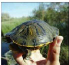
La protection de la tortue Cistude est l'une des priorités de Natura 2000.

Quatre actions précises seront menées cette année.